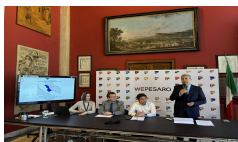
Porto di Pesaro: confronto sul nuov...