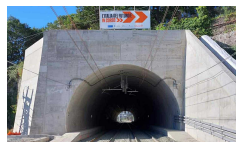
Terzo valico, Rixi: giù il diafram...