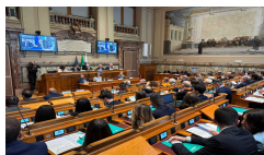
Fermerci: il cargo ferroviario perd...